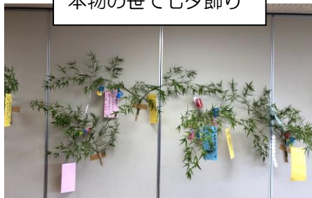
本物の笹で七夕飾り