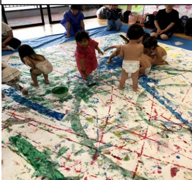
ダイナミックなお絵かき！