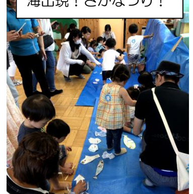
海出現！さかなつり！