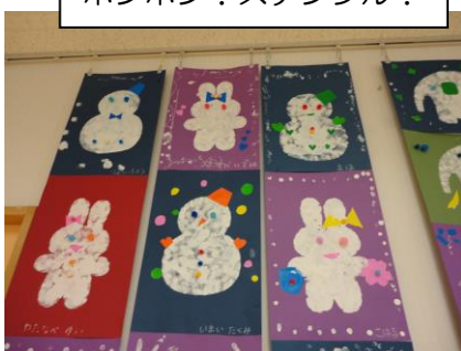
ポンポン！ステンシル！