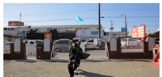
自分で作った凧で、凧揚げをしました！