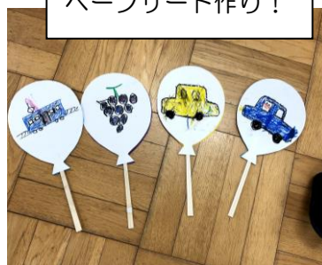
ペープサート作り！